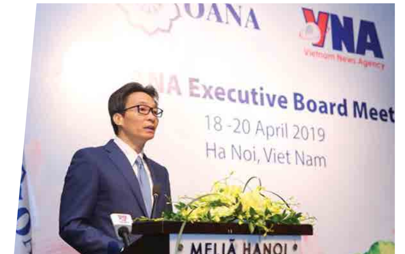
Hội nghị TTXVN - 2019