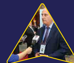
Truyền thông, quảng cáo

V-Lead sở hữu cơ sở dữ liệu lớn về địa điểm sự kiện, mạng lưới đối tác và hệ sinh thái dịch vụ chất lượng phục vụ cho sự kiện tại Việt Nam trong hành trình 15 năm phát triển. Điều này cho phép V-Lead tự tin cung cấp giải pháp trọn gói, và là điểm đến một chặng có thể đáp ứng đầy đủ các yêu cầu về sự kiện của khách hàng.