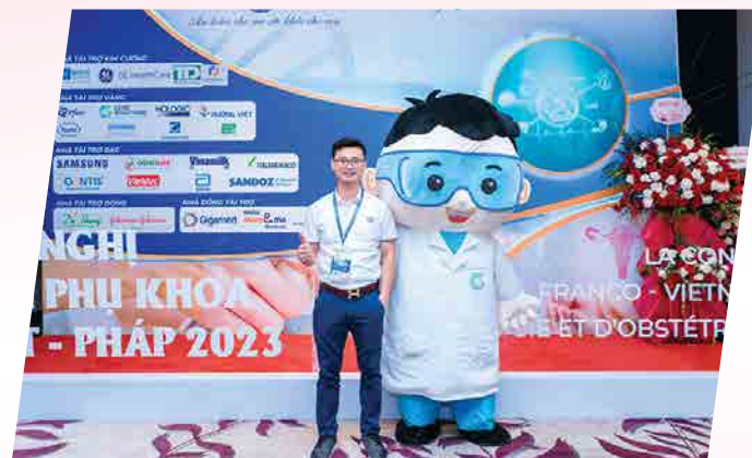
Bệnh viện Phụ sản TW - 2023