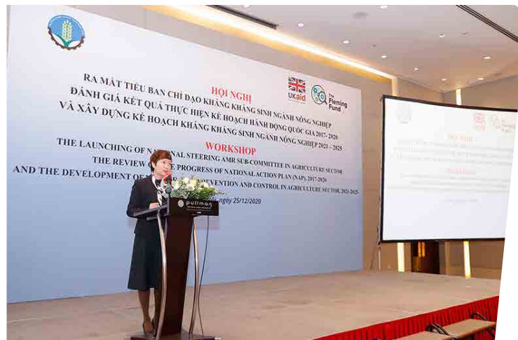
Hội nghị Cục Thú Y - 2020