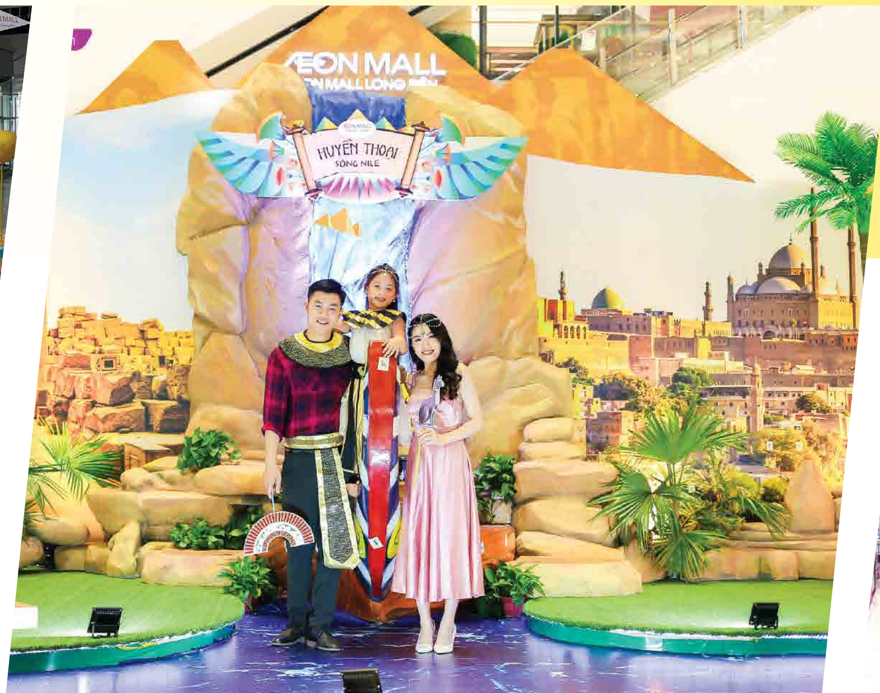
Aeon Mall Long Biên - 2020