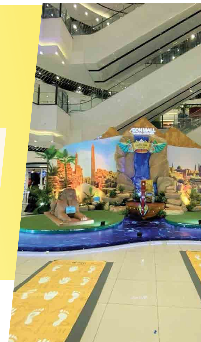
Aeon Mall Long Biên - 2020