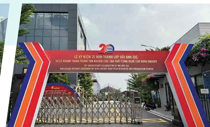
20 Năm thành lập Hải Anh JSC