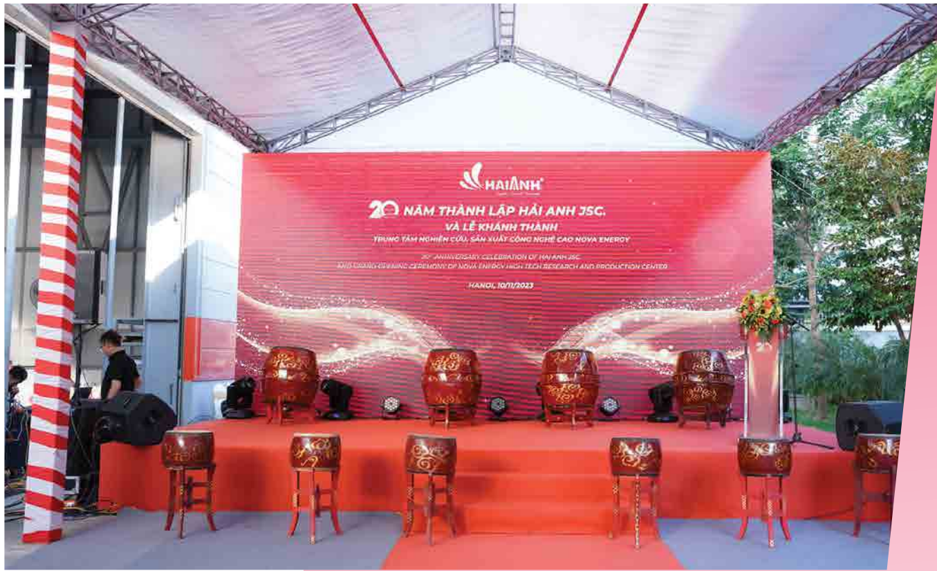
Hải Anh JSC - 2023