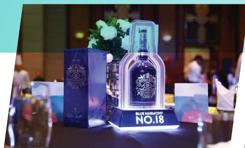
Pernod Ricard - 2018