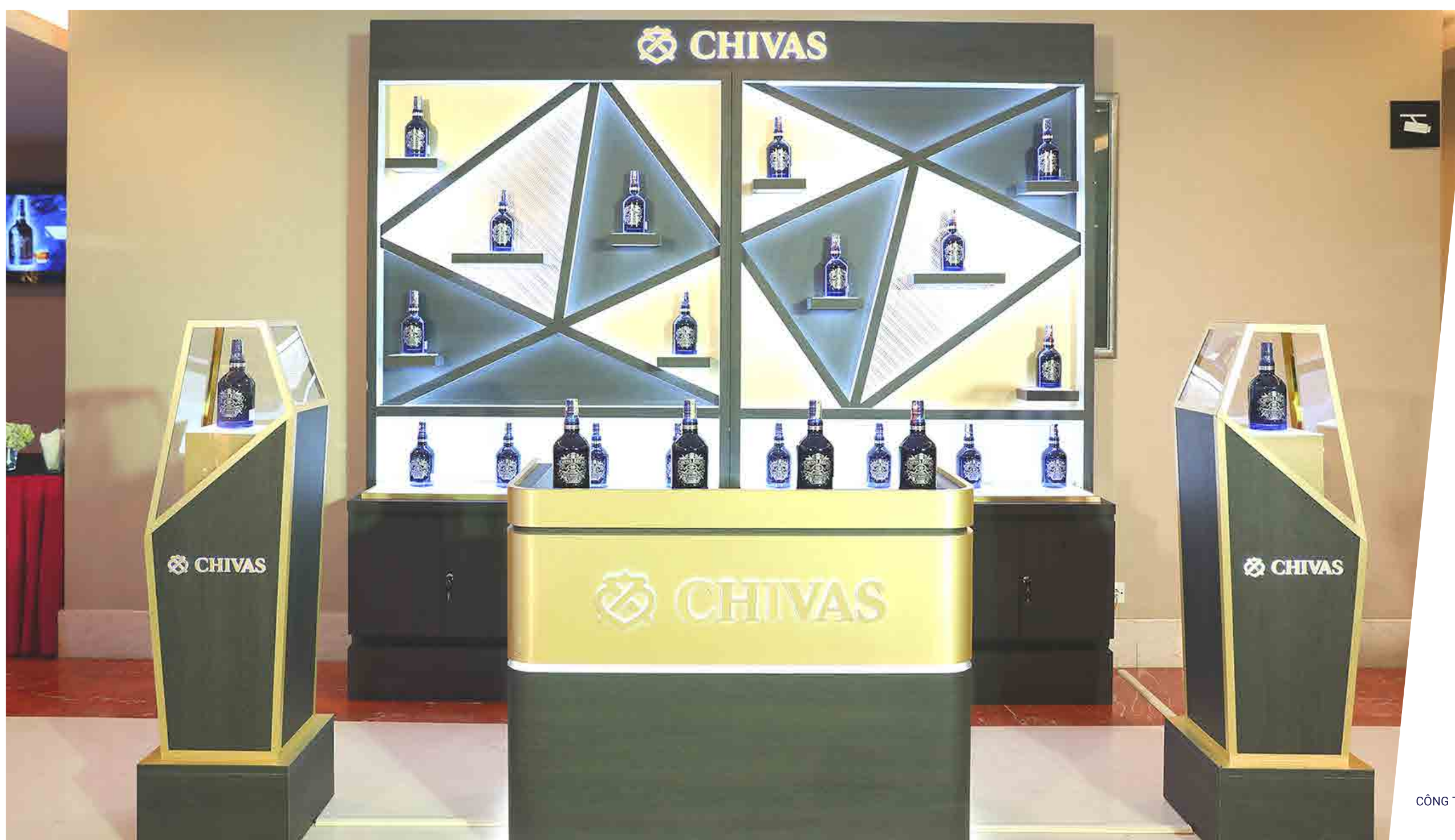
Pernod Ricard - 2018