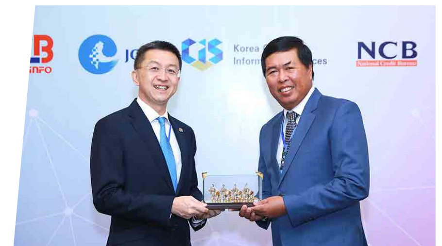
Hội nghị CIC - 2019