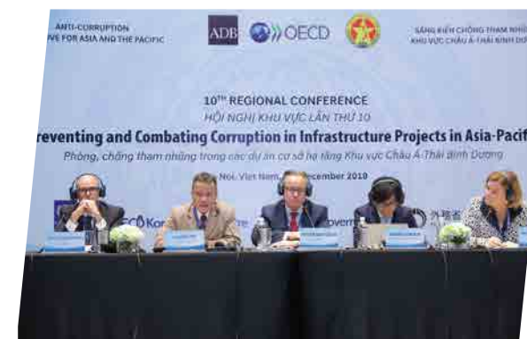
Hội nghị TTCP - 2019