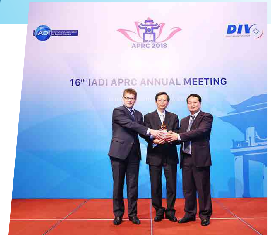
Hội nghị APRC - 2018