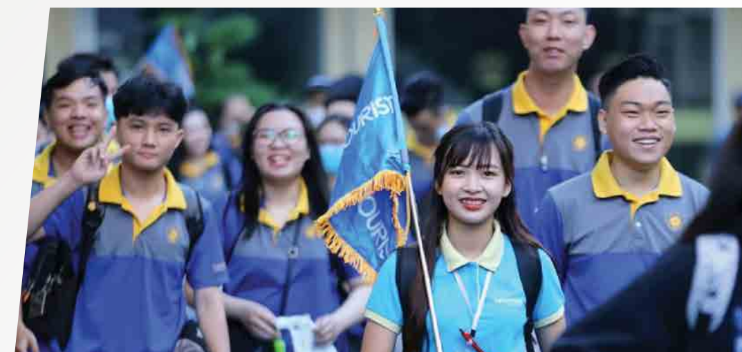
Dịch vụ HDV theo đoàn