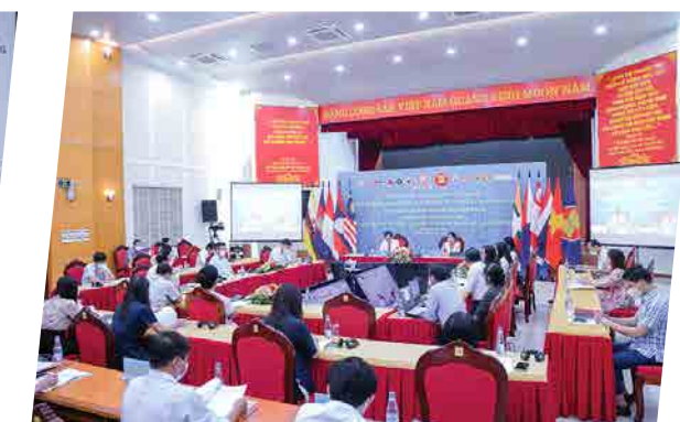
Hội nghị Asean-PAC training Workshop - 2021