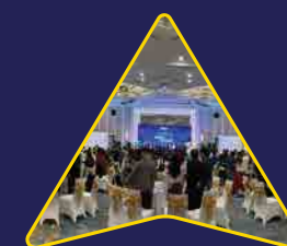
Tổ chức & quản lý Sự kiện

Thành lập năm 2009 với trụ sở chính tại Hà Nội, V-Lead là công ty chuyên nghiệp hoạt động trong lĩnh vực tổ chức và quản lý Sự kiện tại Việt Nam với ngành nghề chính là: