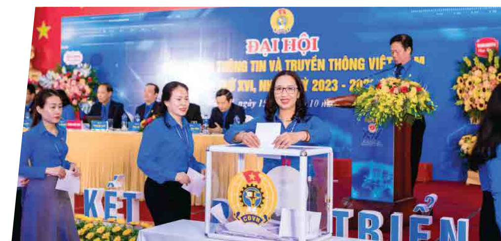
Đại hội Công đoàn Thông tin và Truyền thông Việt Nam