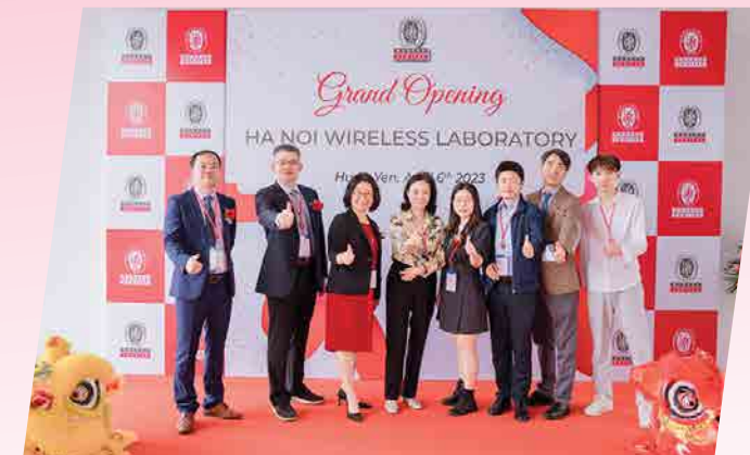
Burieu Veritas - 2023