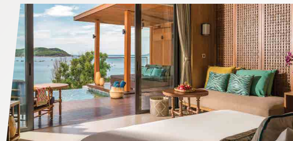
Dịch vụ Phòng nghỉ