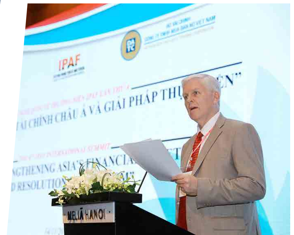
Hội nghị DATC - 2018