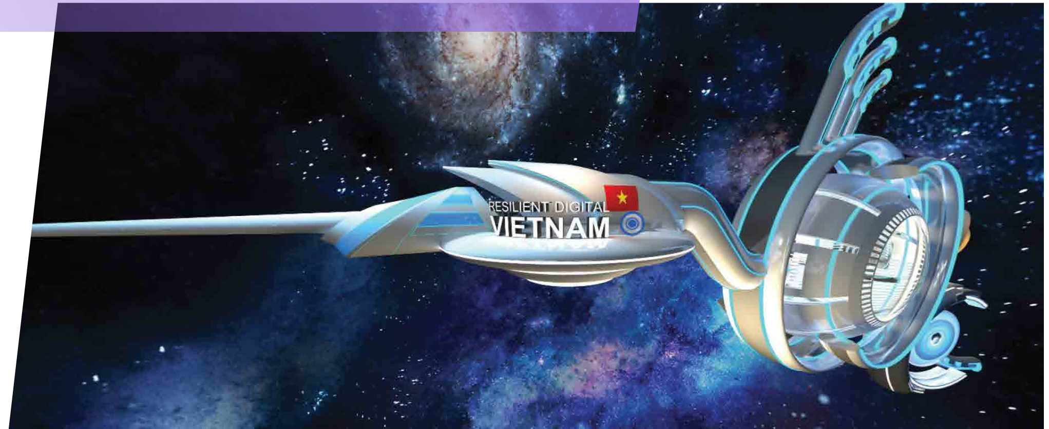
Hội nghị MIC - ITU DW - 2021