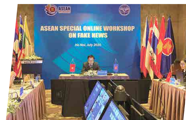
Hội thảo Asian Special Online Workshop On Fake News - 2020