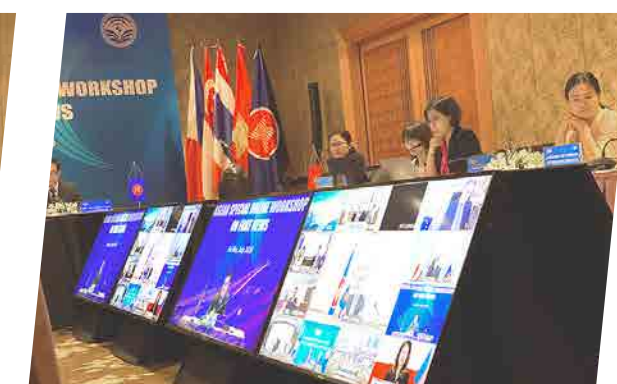
Hội thảo Asian Special Online Workshop On Fake News - 2020