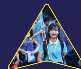
Dịch vụ hỗ trợ Sự kiện