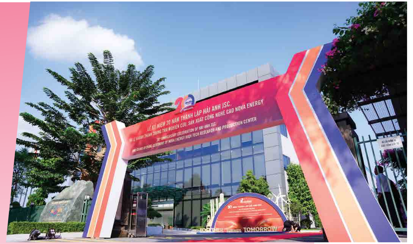
Hải Anh JSC - 2023