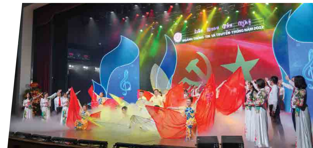
Hội diễn Công đoàn Thông tin và Truyền thông Việt Nam