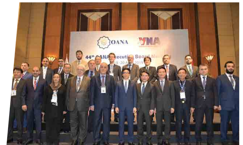
Hội nghị TTXVN - 2019