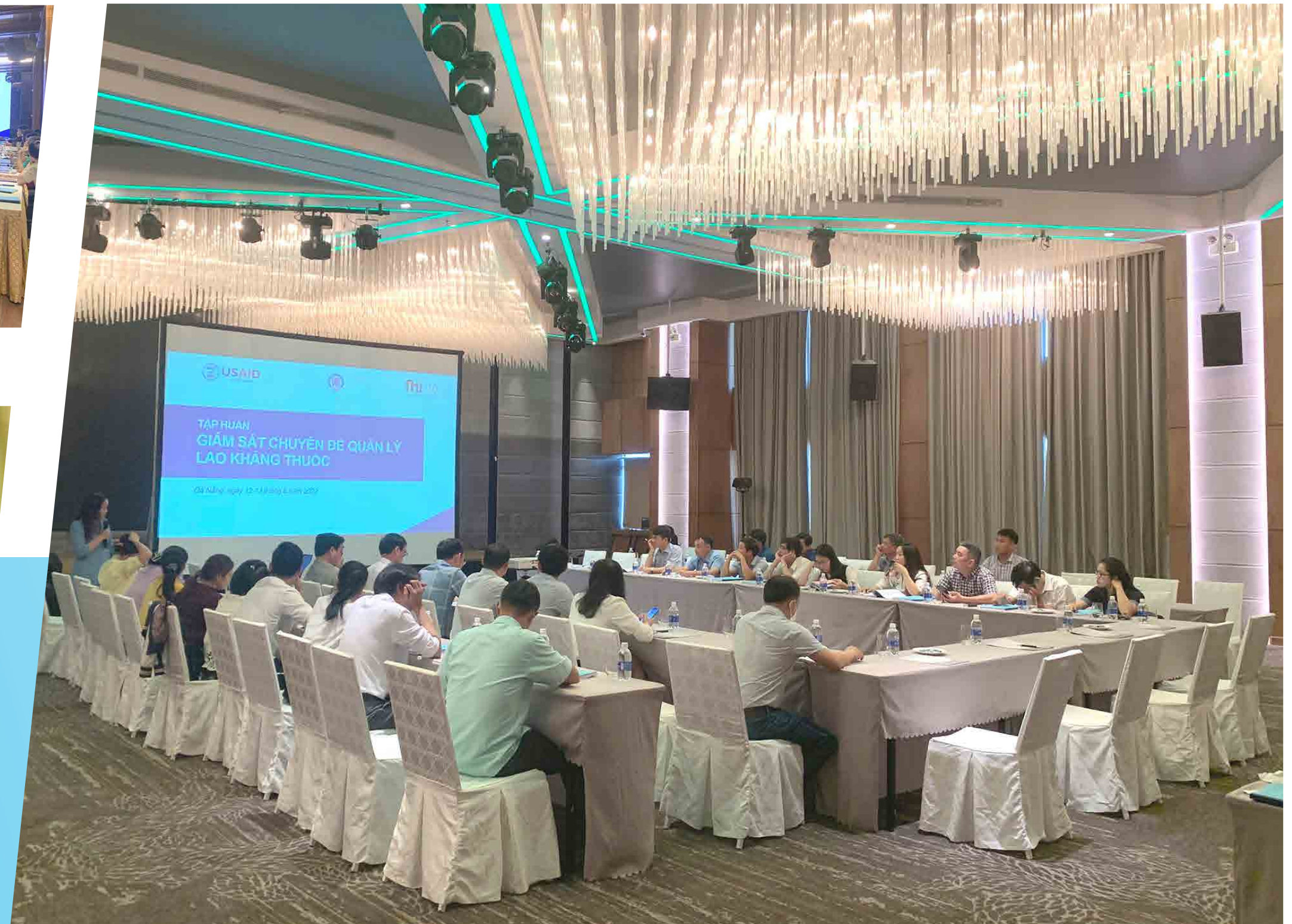
Hội nghị FHI Đà Nẵng - 2022