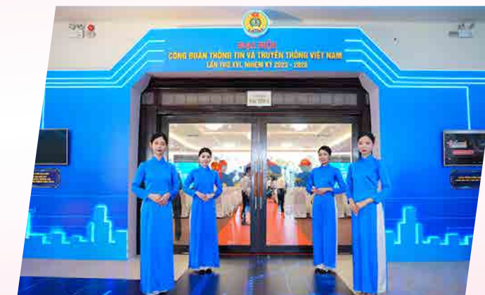
CĐTT Đại hội - 2023