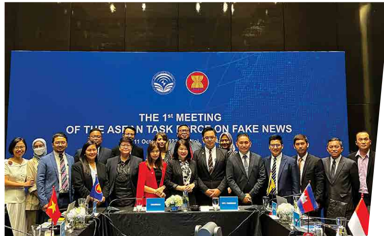
Hội nghị MIC - 2022