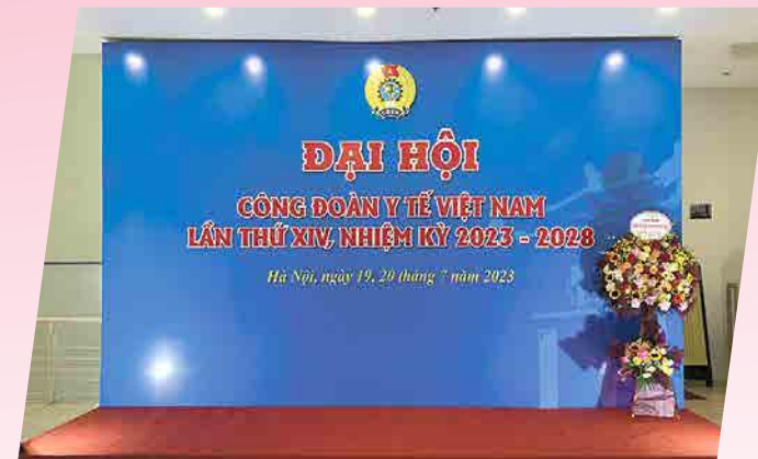
CĐYT Đại hội - 2023