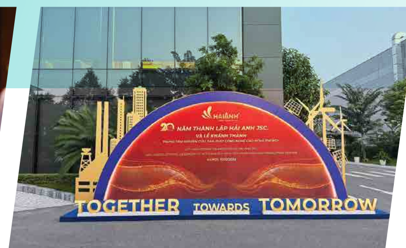
20 Năm thành lập Hải Anh JSC