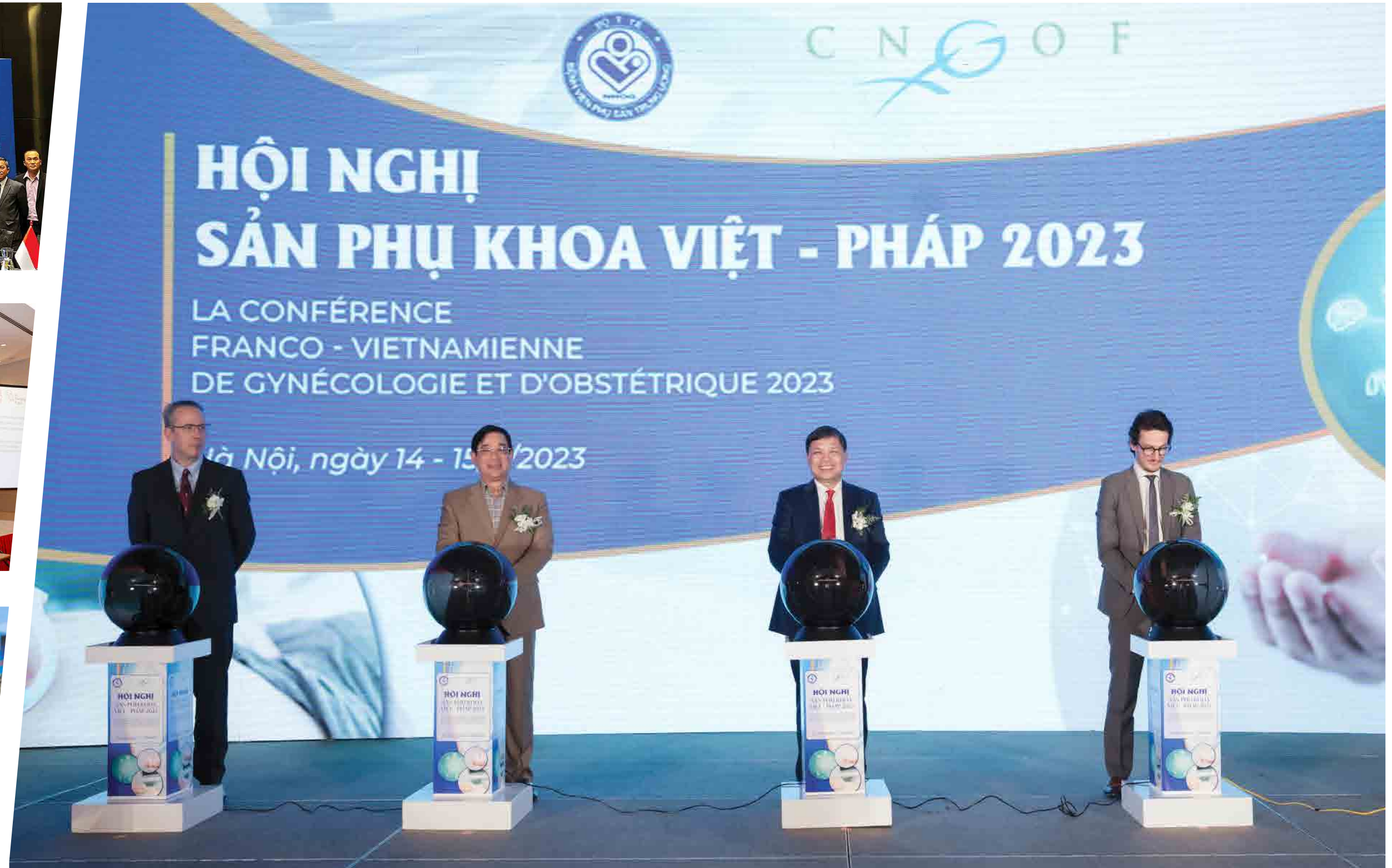
Hội Nghị Sản phụ Khoa Việt - Pháp 2023