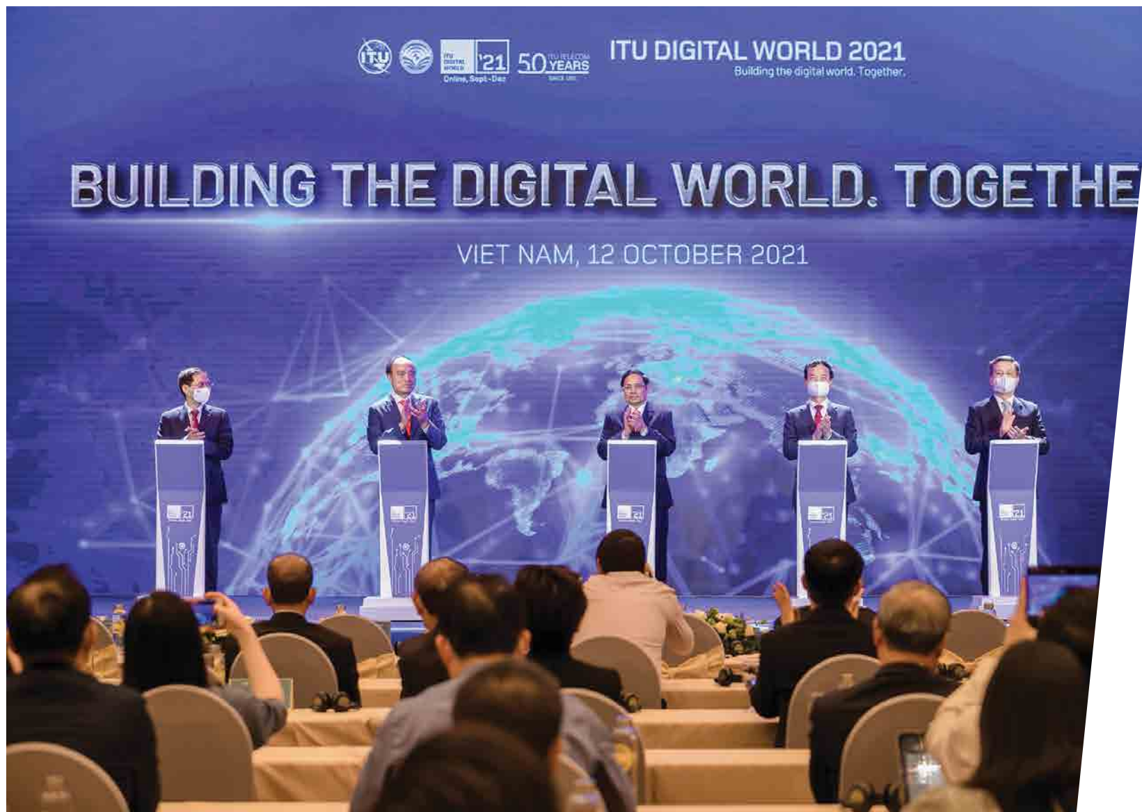
Hội nghị ITU - 2021