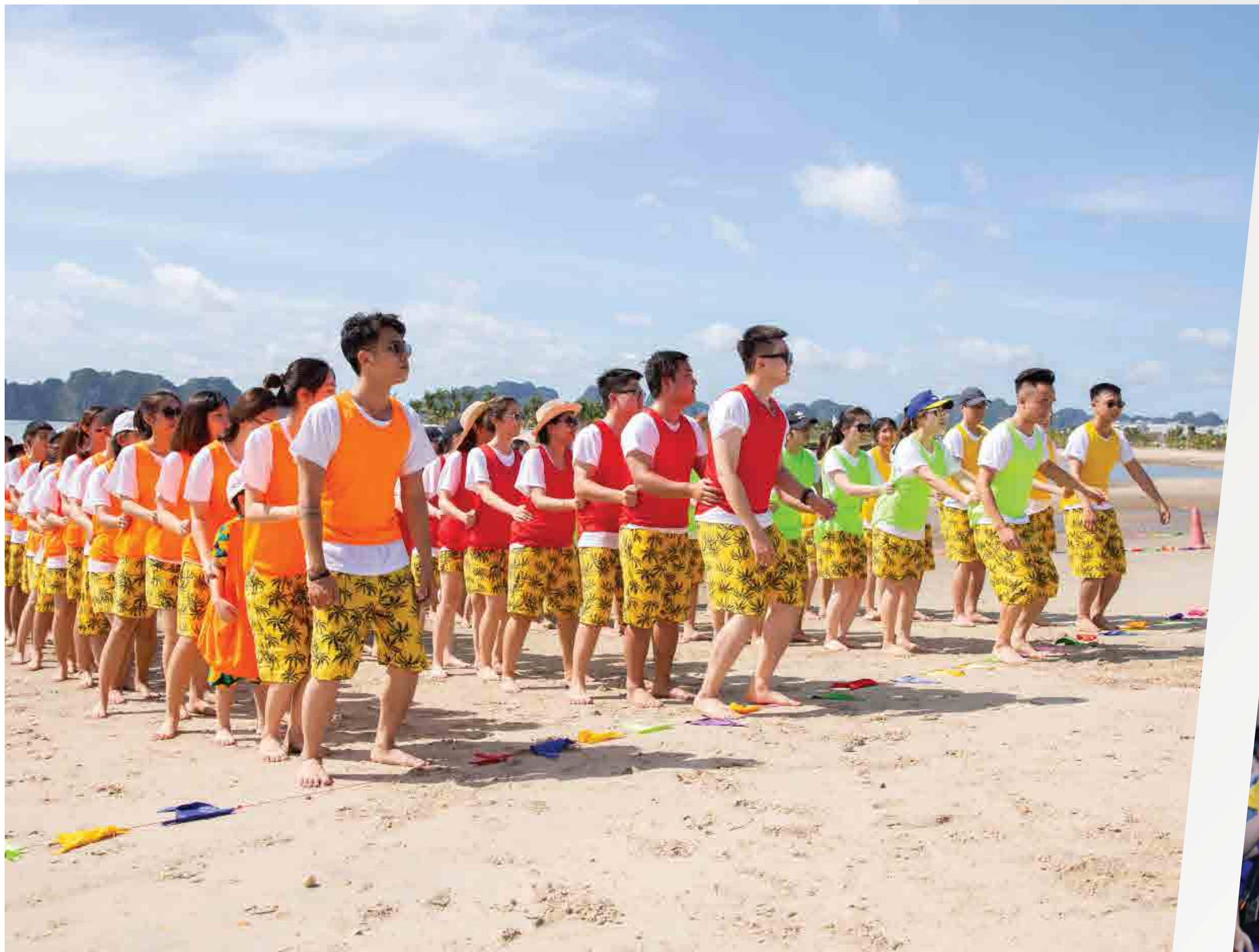
Dịch vụ tổ chức Team Building