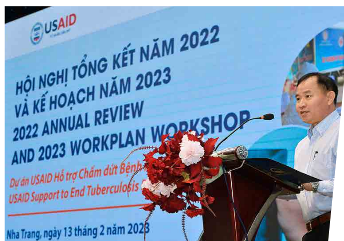
Hội nghị FHI - 2023