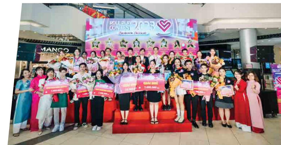
Hội thi của Aeon Mall Long Biên