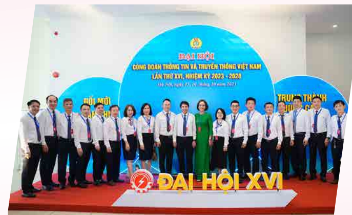
CĐTT Đại hội - 2023